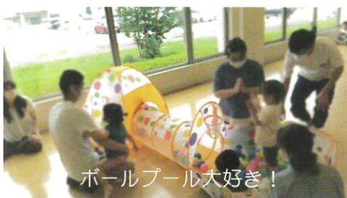
ボールプール大好き！

里親カフェでは、里親さん同士で、気軽に日頃の子育ての話をしたり、悩みや困りごとなどの相談などもすることができます。あなたもぜひ参加してみてください。